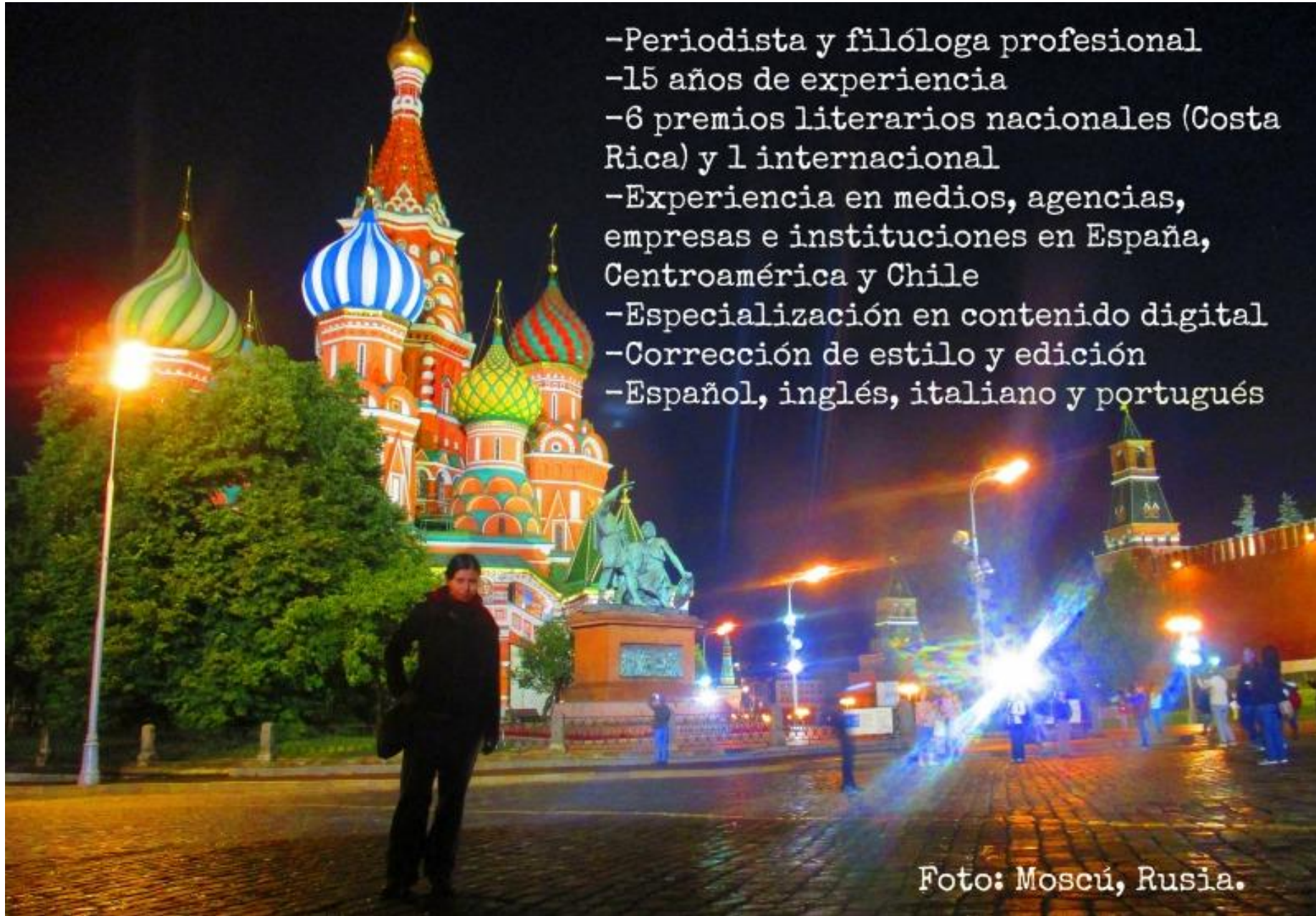
Foto: Moscú, Rusia.