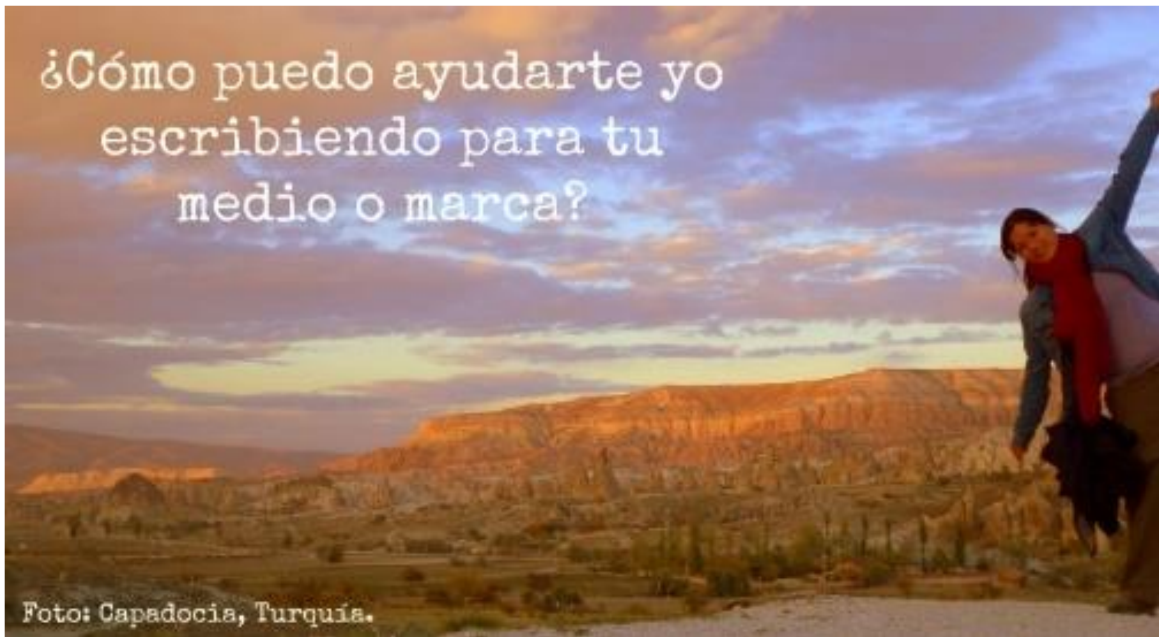
Foto: Capadocia, Turquía.

¿Cómo puedo ayudarte yo escribiendo para tu medio o marca?